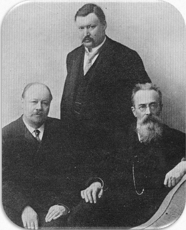
К. Лядов, А. Глазунов, Н. Римский-Корсаков.

В 1900-х Римский-Корсаков создал еще несколько опер — «Кашей Бессмертный», «Сервилия», «Сказание о невидимом граде Китеже и деде Февронии». В эти же годы его учеником стал композитор Игорь Стравинский, который позднее писал: «В моем музыкальном образовании есть одно большое преимущество — я занимался с Римским-Корсаковым. Он был совершенно замечательным педагогом, чрезвычайно внимательным и обстоятельным, мудрым и остроумным».