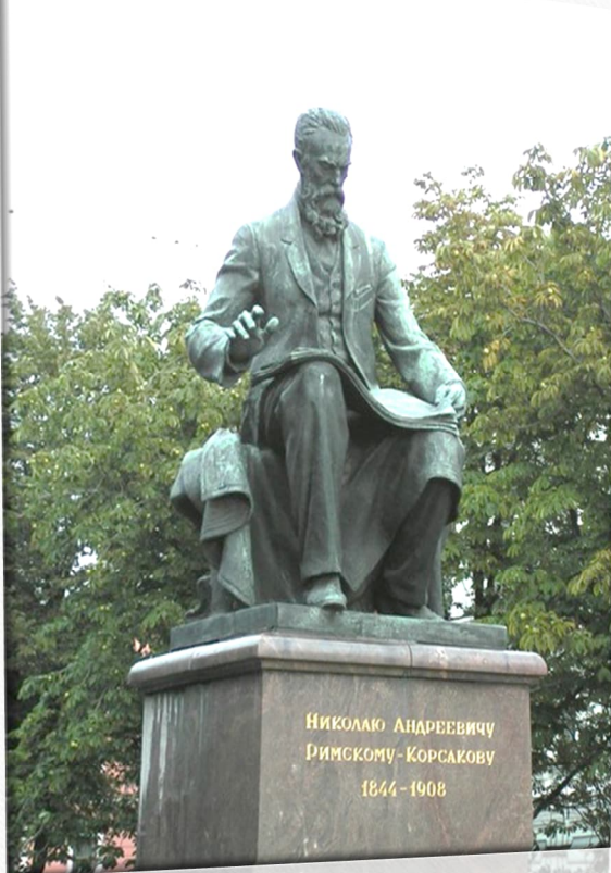
Памятник в Санкт-Петербурге